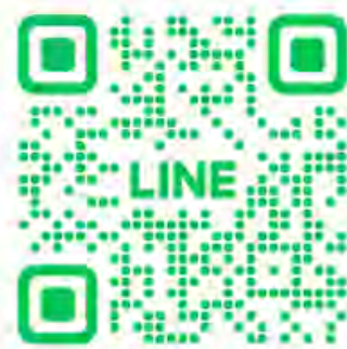
SCTPNews (รับข่าวสารเท่านั้น)