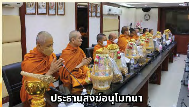
ประธานสงฆ์อนุโมทนา