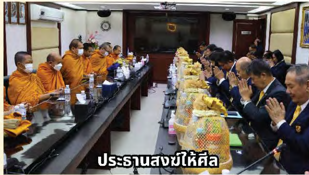
ประธานสงฆ์ให้ศีล