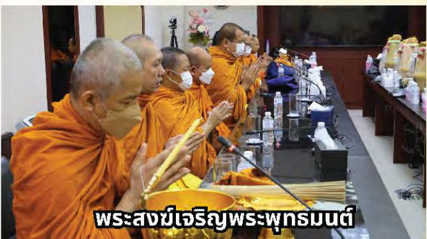
พระสงฆ์เจริญพระพุทธรูป