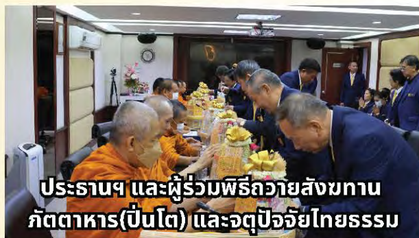
ประธานฯ และผู้ร่วมพิธีถวายสังฆทาน ภัตตาหาร(เป็นโต) และจตุปัจจัยไทยธรรม