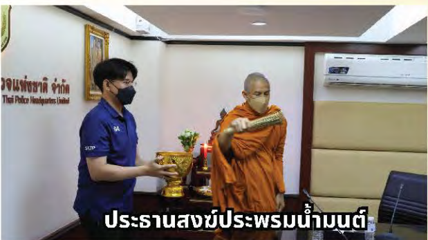
ประธานสงฆ์ประพรมน้ำมนต์