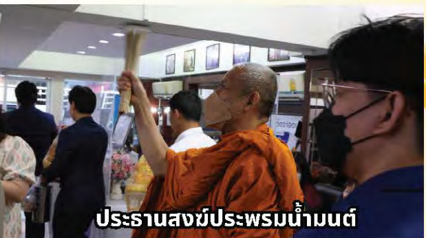
ประธานสงฆ์ประพรมน้ำมนต์