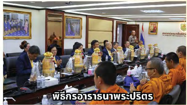
พิธีกรอาราธนาพระปริตร