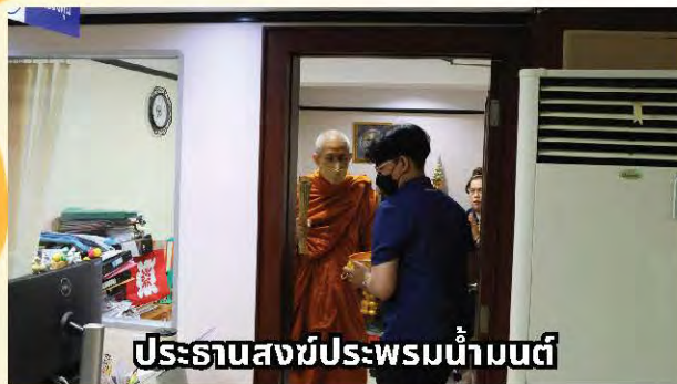
ประธานสงฆ์ประพรมน้ำมนต์