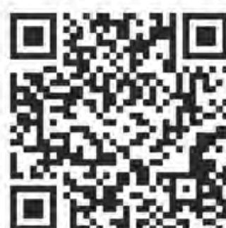
ฝ่ายสินเชื่อ 2 เงินกู้ฉุกเฉิน